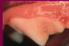
Primera etapa Encías inflamadas