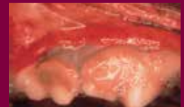
Severa formación de sarro sangrado e infección

Esto Puede resultar en un absceso en los dientes el cual debe de ser retirado. Otro serio problema puede también ser el desarrollo de bacterias que pueden ser esparcidas por todo el cuerpo.