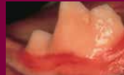
Formación extensa de placa y sarro